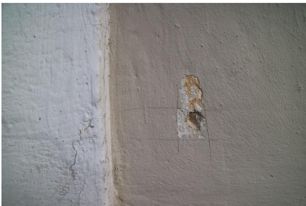
Okrově zlatavá v ploše, pod ní penetrační nátěr a tvrdé novodobé omítky