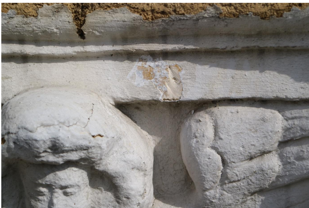
Celek hlavice polopilastru s detailem sondy – s nálezem zlatavě okrového odstínu