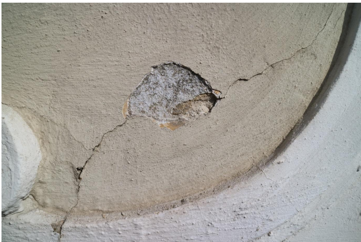
Detail starší tvrdé omítky v ploše s patrným světle šedým nátěrem nejbližší odpovídá barva ze vzorníku Keim 9471.