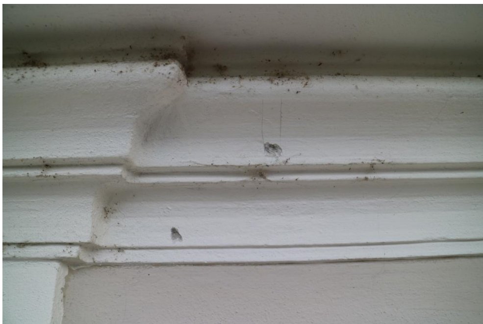
Korunní římsa s navazující hlavicí polopilastru – patrné pouze dva bílé nátěry, novodobá omítka