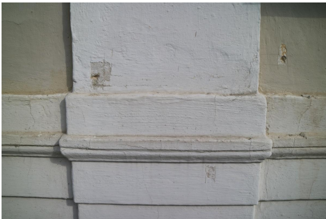
Patka polopilastru s navazující korodonovou římsou, na polopilastru bílé nátěry, v ploše okrově zlatavá viz. detail níže