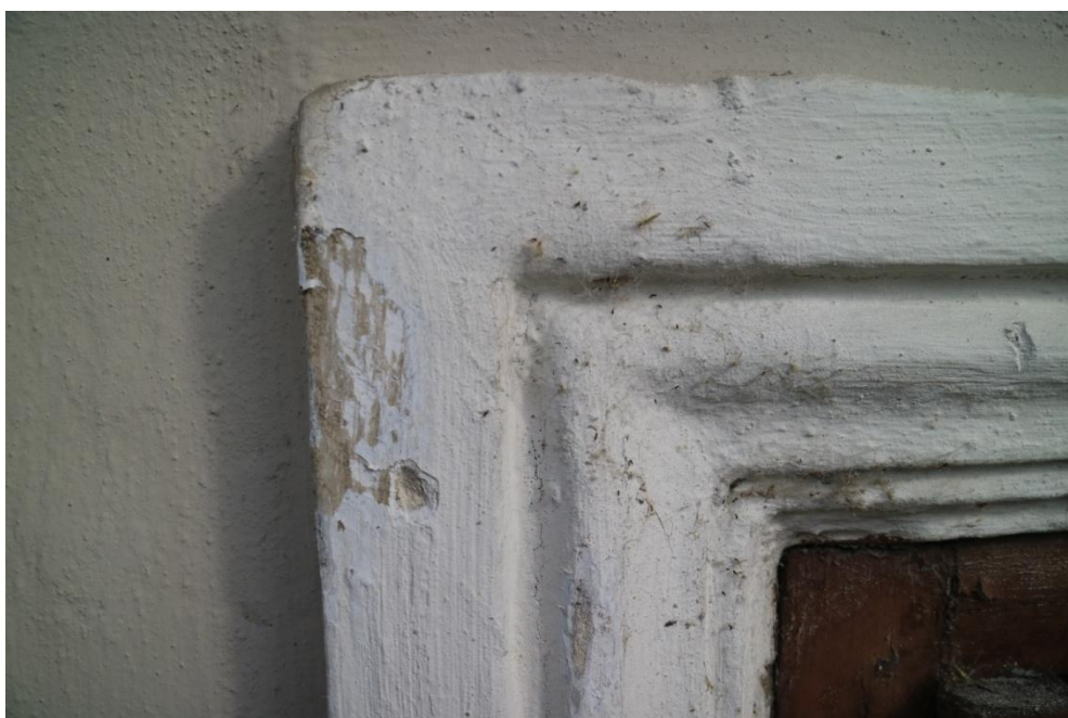
Okenní šambrána v půdním polopatře – parné dvě vrstvy bílých nátěrů a novodobá omítka